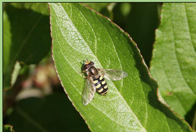
Eupeodes corollae (P. Petit)