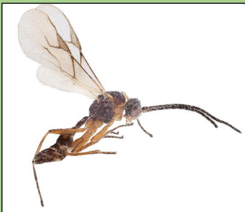
Aphidius ervi (J. Fleury)