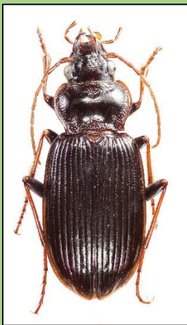
Nebria salina (J.D. Chapelin Viscardi)