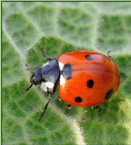
Coccinella septempunctata (A. Ascencio)