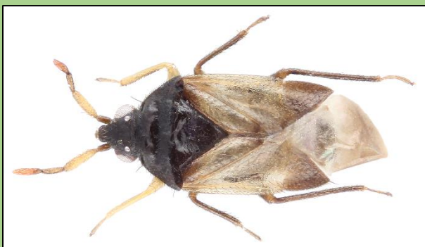
Orius laevigatus (J. Fleury)