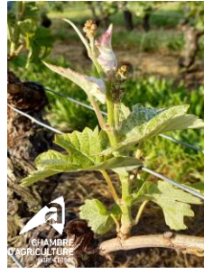
5 - 6 feuilles, pinot meunier, Esvres, 06/05/2024