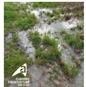
Ruissellement sur sol saturé en eau à Amboise, 06/05/2024