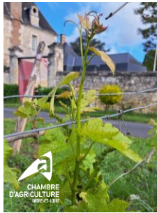
Boutons floraux agglomérés, cabernet, Bourgueil, 06/05/2024