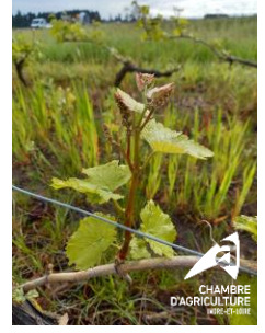
7 - 8 feuilles étalées, chenin, Montlouis, 06/05/2024

Très peu d'évolution générale de la pousse, ralentie par la météo humide et froide pour la saison. Les sols peinent à se réchauffer, saturés par l'humidité qui maintient toute cette fraîcheur. La fin de semaine plus chaude devrait néanmoins la favoriser.