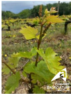
6 – 7 feuilles étalées, grolleau, Rivarennnes, 06/05/2024

Evolution lente sur le chenin et le cot. Stable sur le sauvignon.