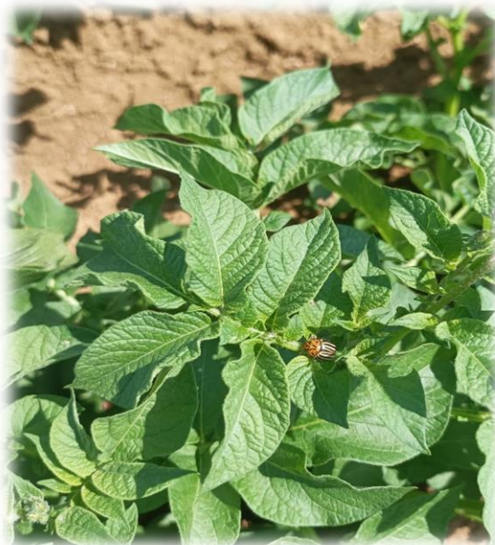
Doryphore adulte, secteur Oinville dans le 45