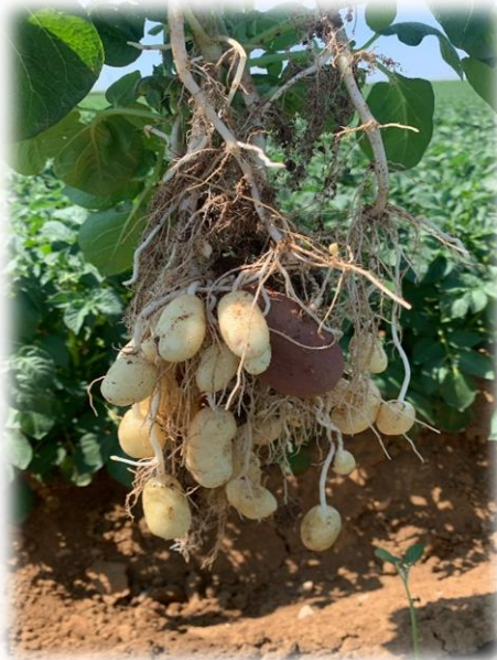
Tubérisation observée dans le 28 sur culture de grenaille