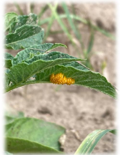
Œufs de doryphores observés en début de semaine à Beffes dans le Cher