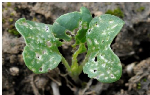
Plus de 25 % de la surface touchée