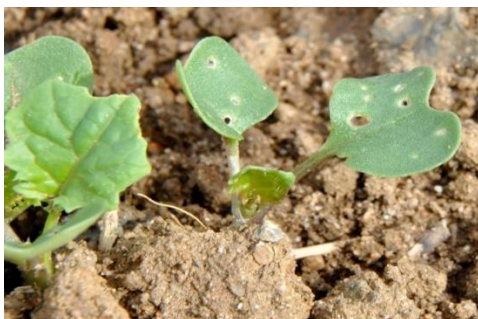
Moins de 25 % de la surface touchée

→ 8 pieds sur 10 portants des morsures. Il ne faut pas dépasser plus ¼ de la surface végétative détruite. Au-delà du nombre de plantes avec dégâts, il est important de déterminer la surface végétative endommagée.