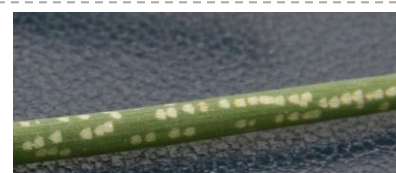
Piqûres de nutrition sur ciboulette (Photo CA41)

L'activité de nutrition est nécessaire et précède de peu la ponte. On considère donc que le risque est lié à la présence de piqûres de nutrition. L'observation des piqûres de nutrition sur les alliums présents sur votre exploitation est le meilleur indicateur de risque. Ces piqûres sont facilement visibles sur oignon ou ciboulette (cf photo).